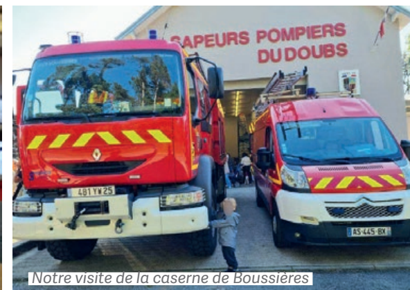
Notre visite de la caserne de Boussières