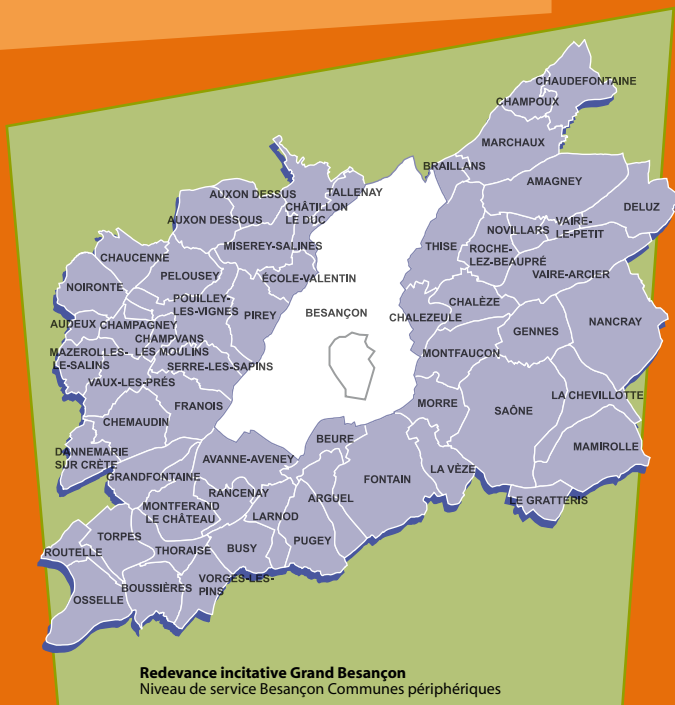
Redevance incitative Grand Besançon Niveau de service Besançon Communes périphériques

Application de nouvelles modalités de calcul avec une nouvelle grille tarifaire incitative qui sera votée en juin 2012.